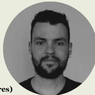
Robin Guillou (création lumières)